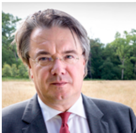
Commissaris van de Koning Wim van de Donk