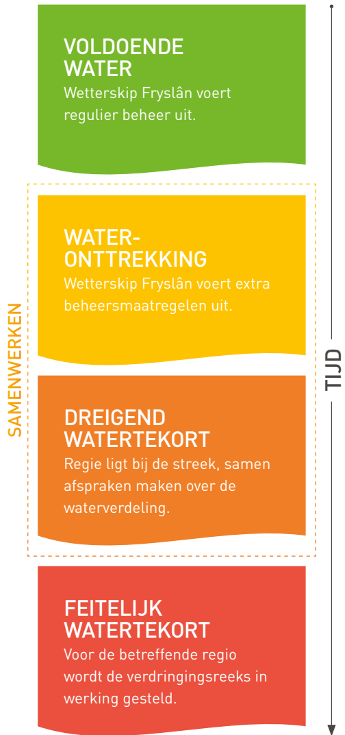
Figuur: opschaling en verantwoordelijkheden bij lokaal dreigend watertekort.

Een van de maatregelen uit de verdringingsreeks is het instellen van een beregeningsverbod. In 2018 is een tijdelijk beregeningsverbod ingevoerd voor ons hele beheergebied, Fryslân en een deel van het Groninger Westerkwartier. We realiseren ons dat het instellen van een beregeningsverbod grote gevolgen kan hebben voor de agrarische sector in het betreffende gebied.