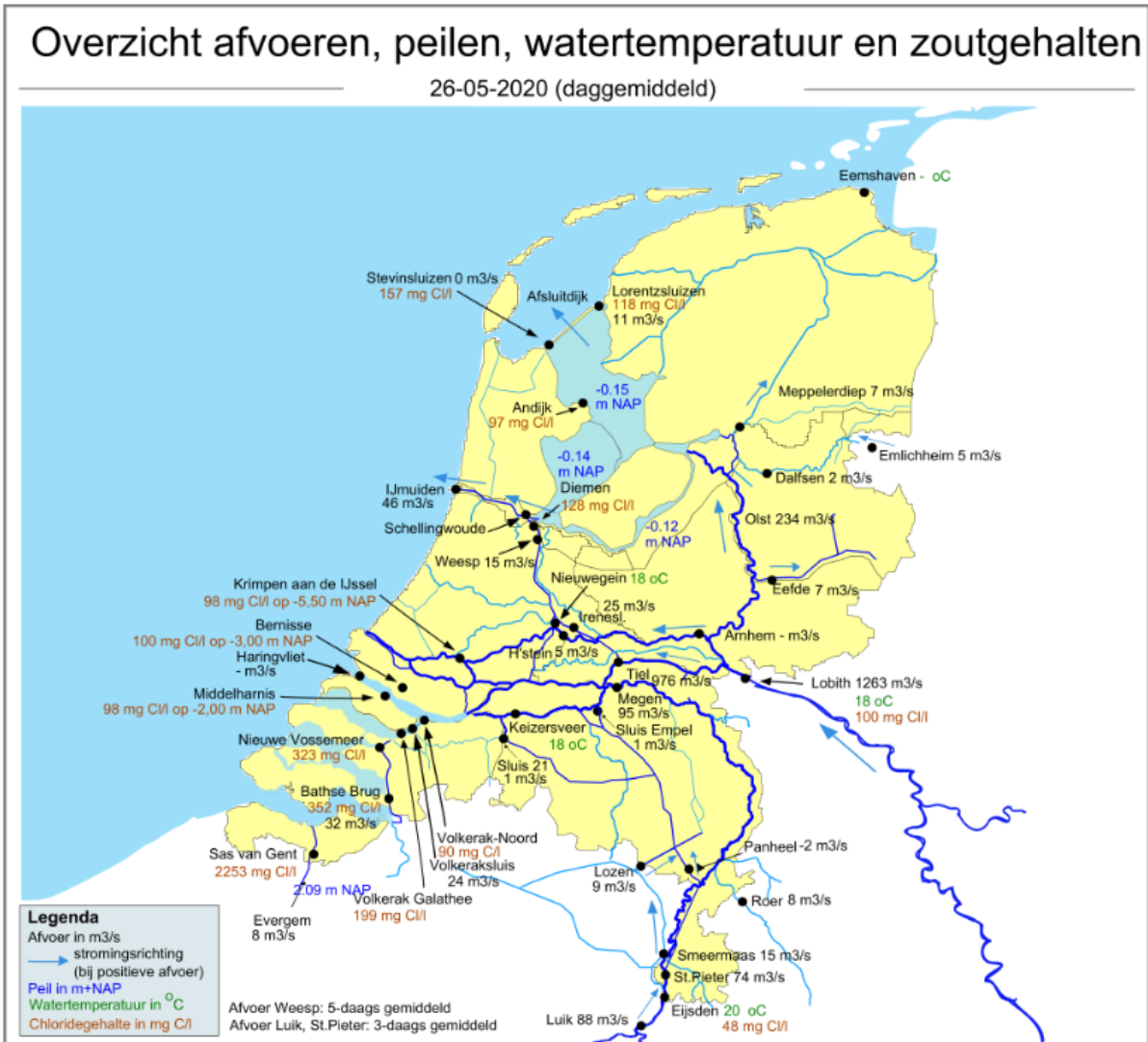
Figuur 3: Overzicht afvoeren, peilen, watertemperatuur en zoutgehalten, daggemiddelde 26 mei 2020