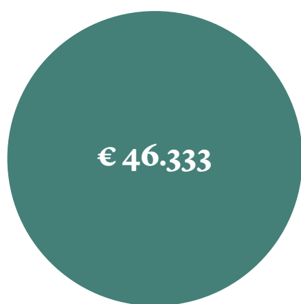
Inkomen per akkerbouwer (gem. 2019–2021) 1